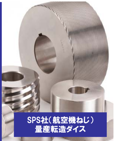
SPS社(航空機ねじ) 量産転造ダイス