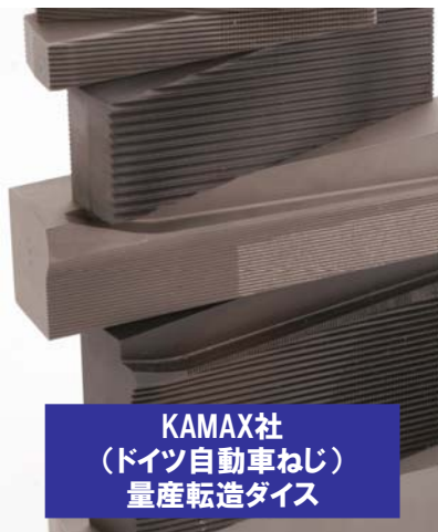
KAMAX社 (ドイツ自動車ねじ) 量産転造ダイス